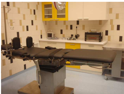
Operační sál jednodenní chirurgie