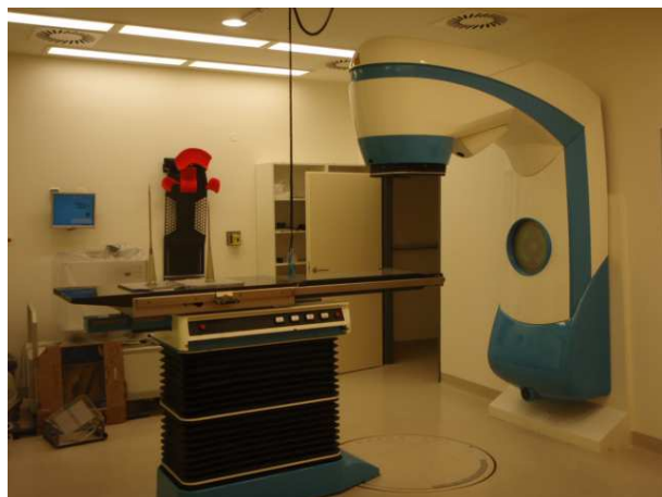
Kobaltový ozařovač TERABALT