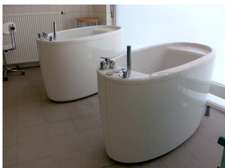
vířivky pro dolní končetiny