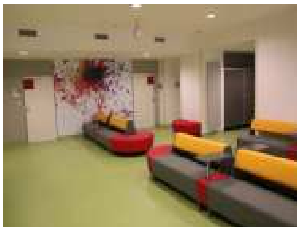
Cekárna transfuzní stanice