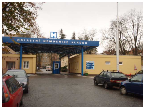
Vjezd do areálu