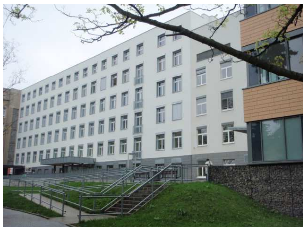
Pohled na blok B