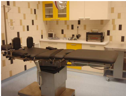
Operaciční sál jednodenní chirurgie